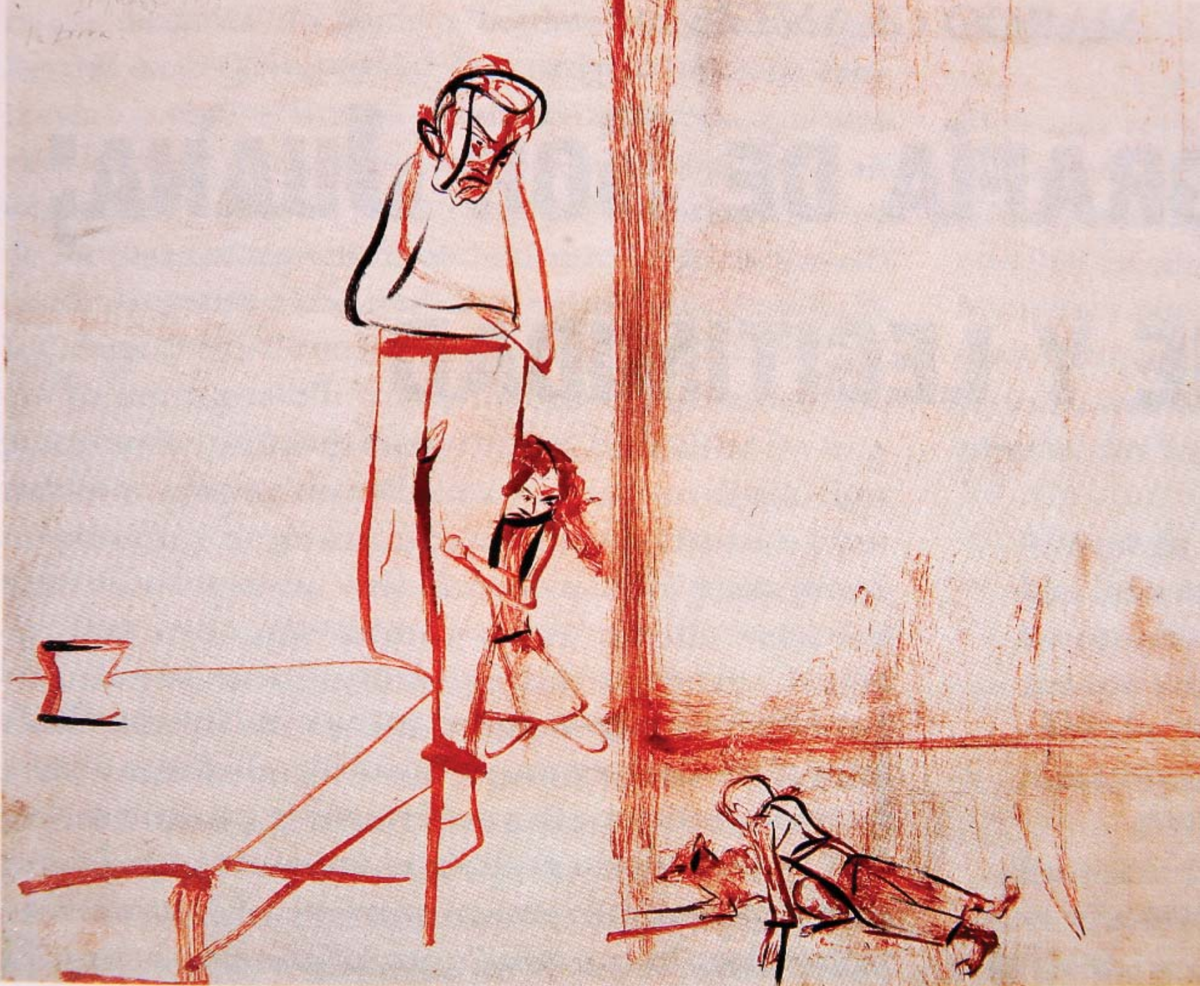
De la serie La niña precoz : "La zorra", 1994