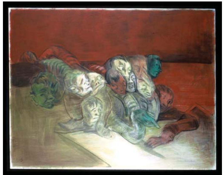
Hombres gusano , 2005. Temple sobre tela.