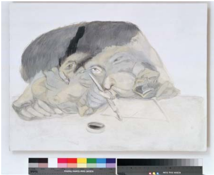
Línea (identidad) , 2004.