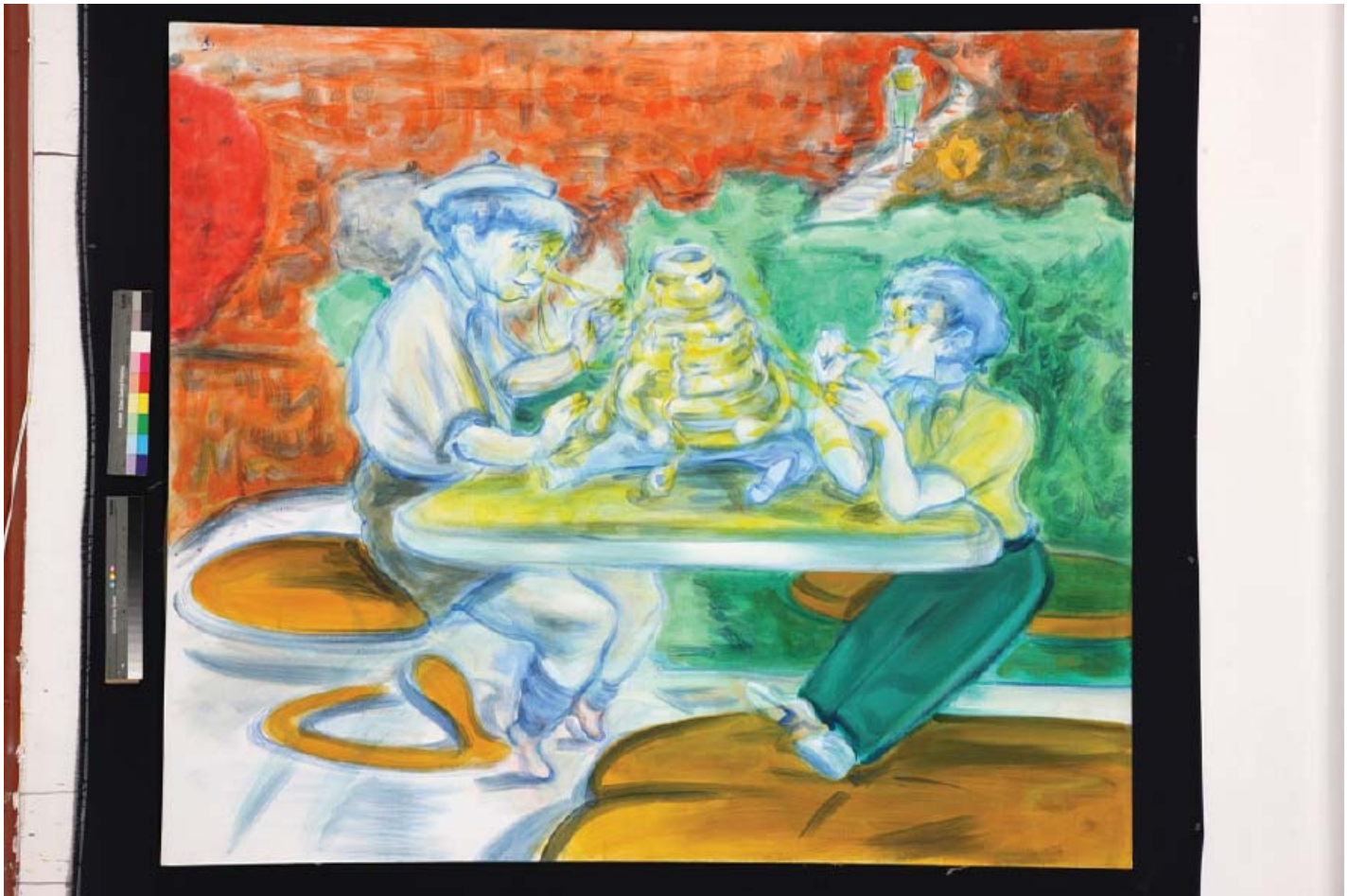
Infancia miel , 2008. Temple sobre tela.