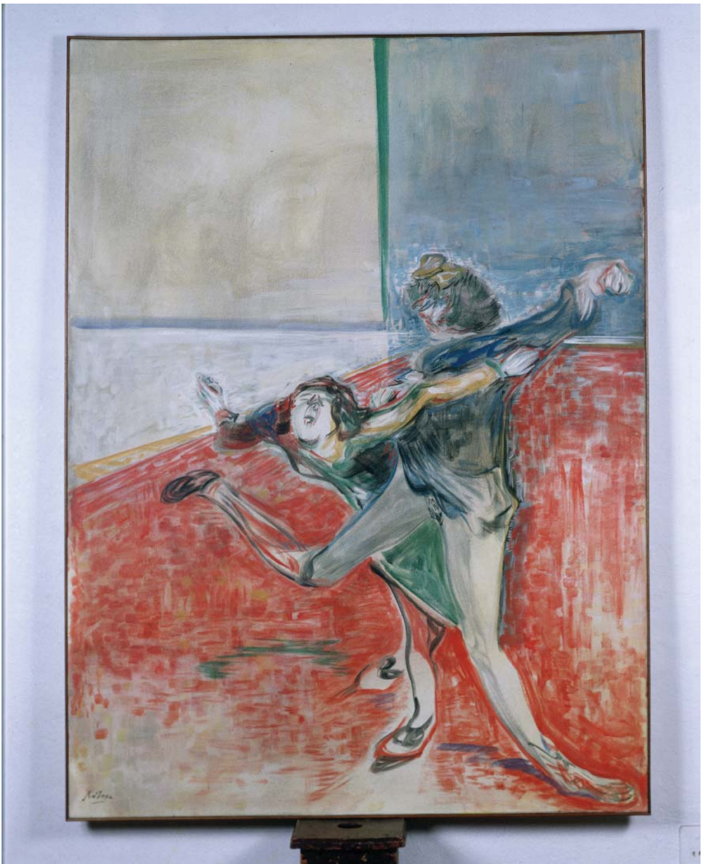
De la serie El medio inteligente : "Mocos", 1994. Temple sobre tela.