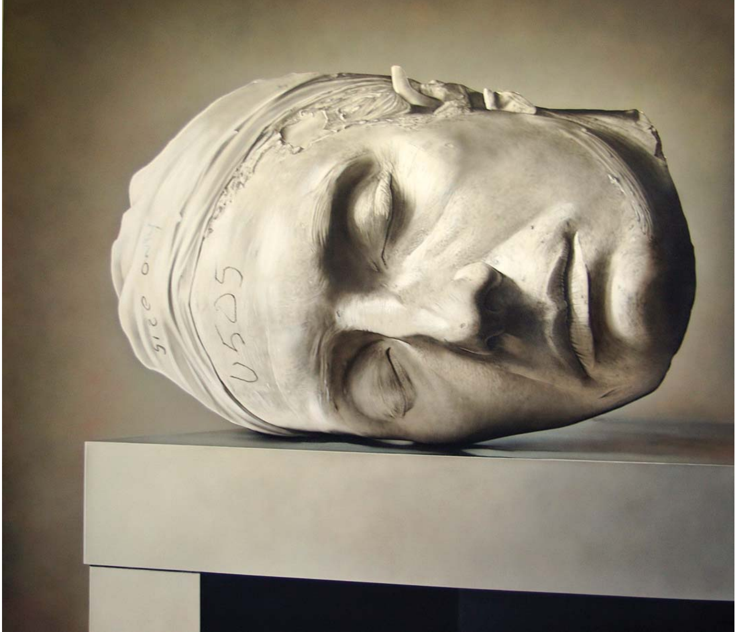
White Head, 2005

guaje, el asunto formal, es universal; pero es sólo para distribuir mejor las ideas. Por otro lado –como le consta y así lo ha dicho my man Damien Hirst– no es fácil hacer cuadros “realistas”. Yo creo que los hago por la misma razón que Mick Jagger se tira a las modelos: porque puedo.