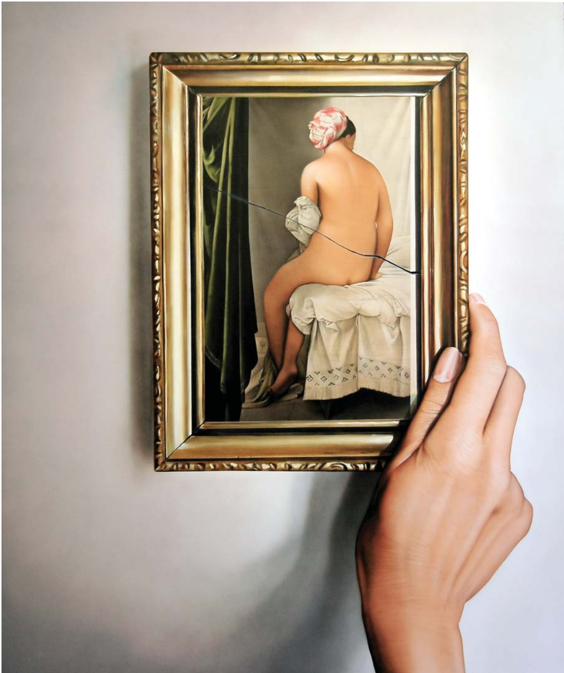
Broken Ingres, 2005