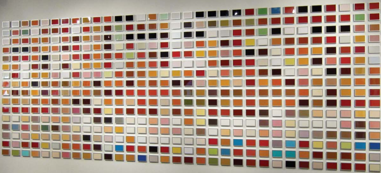
512 Drinks, 2007. C-prints