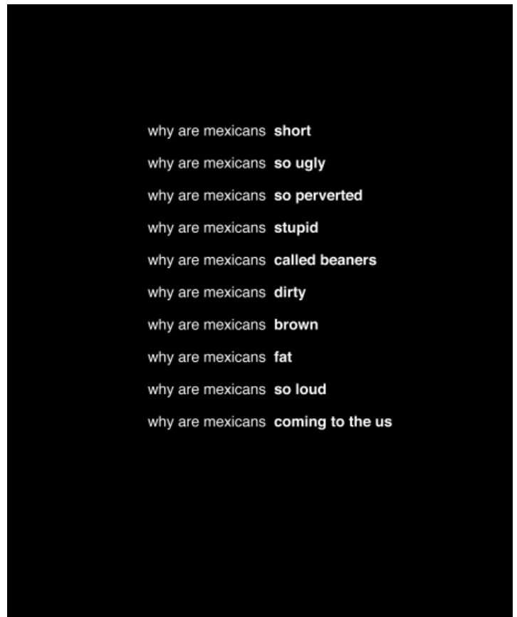
Why are Mexicans... / Why are Americans. From Ask Google Series