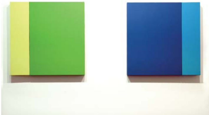
Movistar, 2010. From Logos Serie