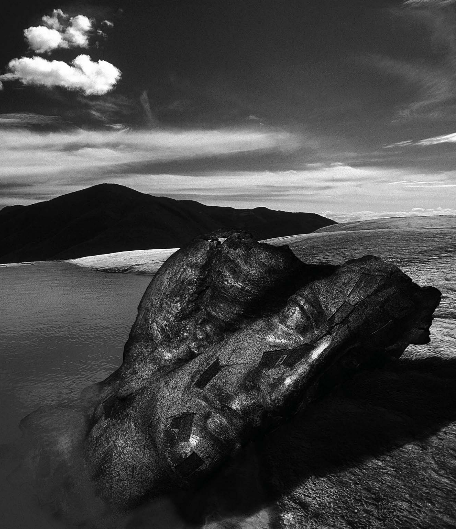
Hierve el ángel, 2006