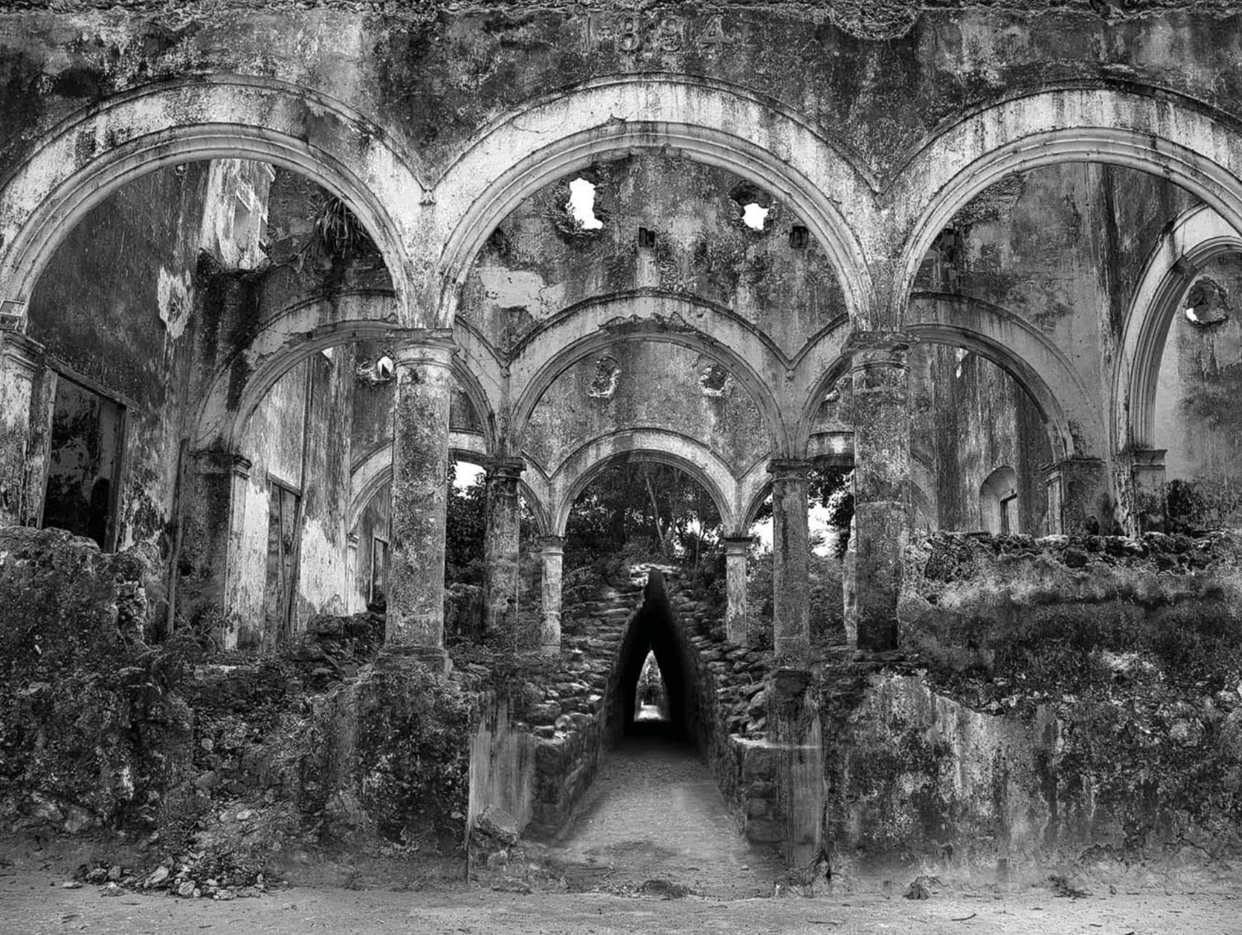
◀ Ascensos, 2007